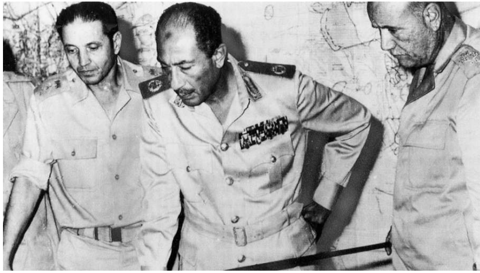
خسيسيتهم في نظر شعوبهم.

لقد احتفلت رئيسة وزراء بريطانيا السابقة تيرزا ماي مع رئيس وزراء كيان يهود نتياهو عام 2017 في ذكرى مرور مئة عام على وعد بلفور الذي وعدت فيه بريطانيا يهود بإقامة وطن لهم في فلسطين، وذكرت أن بريطانيا لن تعتذر عن إقامتها لهذا الكيان وهي غير نادمة. وأمريكا تواصل الدعم لكيان يهود. فالمعركة ضد الأمة الإسلامية يقودها الإنجليز والأمريكان، فعلى المسلمين أن يدركوا ذلك إدراكا تاما. علما أن اليهود والنصارى بعضهم أولياء بعض، ومن يتولاهم من المحسوبين على الأمة فهو منهم، وحسابهم عسير عند رب العالمين.