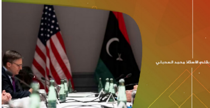
بفلم: الأستاذ محمد السحباني

ما فتنت أمريكا تمنع في احتلال بلاد المسلمين عنوة بدعوى محاربة الإرهاب والتطرف وتحقيق الاستقرار ونشر التنمية. وما هي اليوم تقتحم أسوار ليبيا بالدعوى القديمة نفسها، فتتزل بكل ثقلا لتقود المسار السياسي في ليبيا بنفسها.