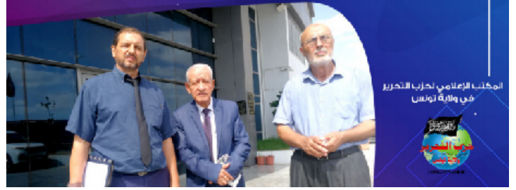
المكتب الإعلامي لحزب التحرير في ولاية تونس